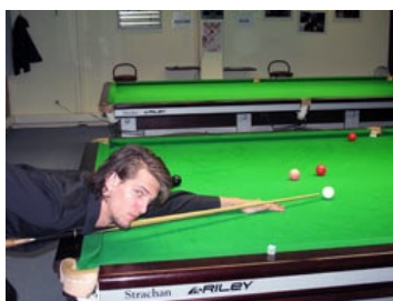
BOBEK ("Touching Ball")